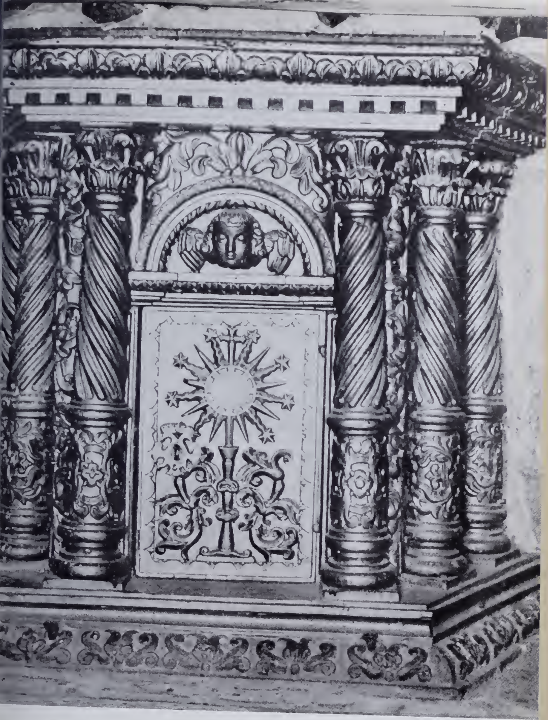
Jesús María. El Sagrario de la Iglesia. Madera de cedro paraguayo tallada y dorada.